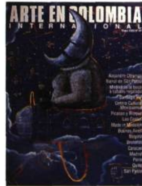
Arte en Colombia, Bogotá.