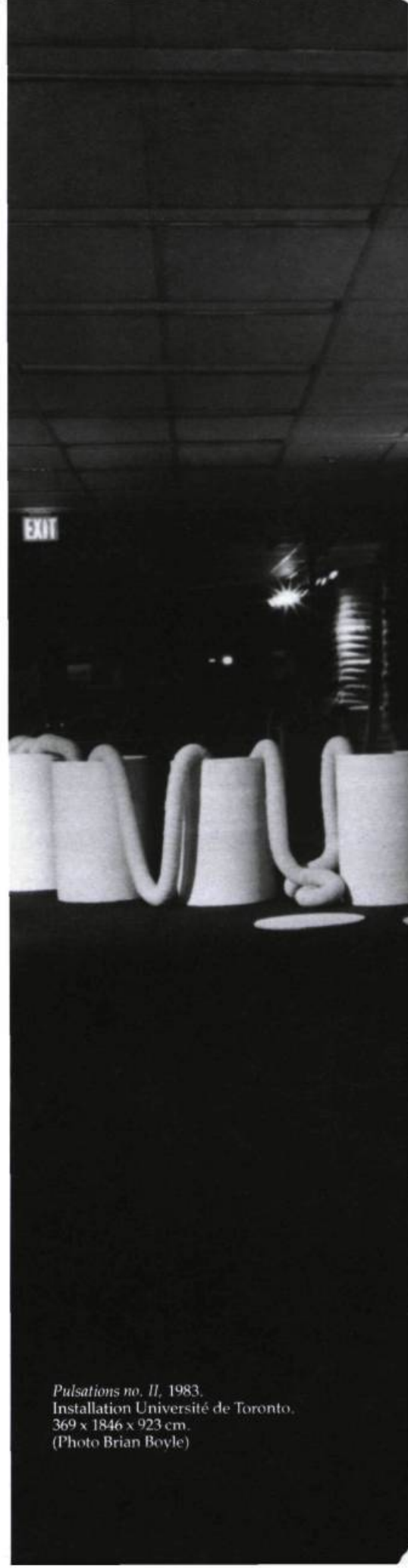
Pulsations no. II, 1983. Installation Université de Toronto. 369 x 1846 x 923 cm.