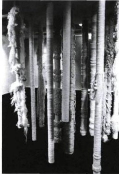
Forêt, 1977. 241 x 159 x 154 cm.