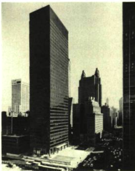
Ludwig MIES van der ROHE

THE MUSEUM OF MODERN ART, 11, 53 e Rue Ouest. Jusqu'au 15 avril: Mies van der Rohe (1886-1969) - Son architecture et ses meubles; Jusqu'au 13 mai: Richard Serra, Rétrospective; A partir du 20 mai: Jasper Johns, Rétrospective de sa gravure; Jusqu'au 24 juin: W. Grancel Fitz (1894-1963), Photographies publicitaires.