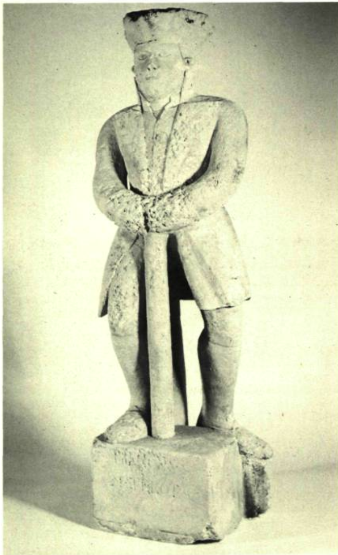
11. Officier de marine ou garde-chiourme. Art populaire du 18 e siècle. Pierre calcaire de Rochefort. Inscription sur le socle: Prince des matelots.

L.L. — Où en est la collection actuellement?