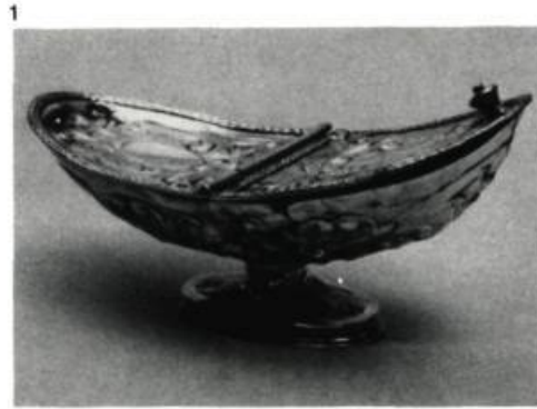
1. ANONYME (France, Fin du 17 e siècle). Navette. H.: 8 cm; Long.: 15,5; Larg.: 7,3. Poinçons: Une fleur de lys couronnée; deux grains; P, une croix, L. Québec, Monastère des Ursulines.