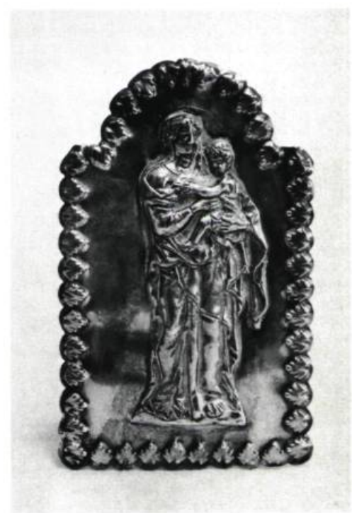
5. Instrument de paix, entre 1764 et 1775. H.: 14 cm; Larg.: 8,5. Poinçons: Une couronne; DZ. Québec, Archevêché.