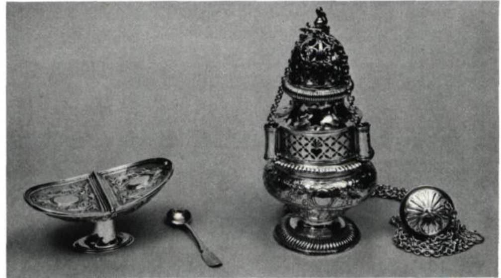
3. ANONYME (France, Fin du 17 e siècle). Encensoir. H.: 21 cm 5; Aucun poinçon. Québec, Monastère des Ursulines.