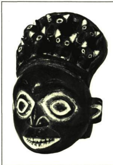
3. Masque heaume en bois. Haut.: 16 pces \frac{1}{4} ; Larg.: 12\frac{1}{2} ; Prof.: 12.

D'un point de vue strictement historique, il y a convergence entre ce moment où la civilisation européenne de la fin du 19 e siècle, délaissant la représentation naturaliste, se porte vers l'étude des couleurs et de la perception rétinienne (Impressionnisme, Nabis, École de Pont-Aven) et le moment où elle découvre l'arabesque japonaise, les formes simplifiées — expressionnistes et non naturalistes — de l'art primitif. Et ce n'est pas un hasard si, à la même époque, on commence à étudier les dessins des enfants et les productions des malades mentaux. Le seul, Gauguin fait le grand bond vers ces primitifs qui le fascinent. Arrivé aux Iles, c'est plus au mode de vie des indigènes qu'il s'intéresse qu'aux produits de leur art ancestral.