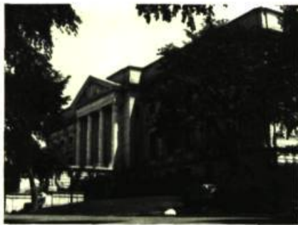
1. La façade du Musée.

Pendant longtemps, au Québec, la production artistique se limitait à une certaine forme d'artisanat. Les orfèvres ciselaient de fort belles pièces dont le nombre restait limité en raison du manque de matière première. Parfois, faute de pouvoir se procurer de l'argent, les orfèvres refaisaient la même pièce à deux ou trois reprises, car c'était l'unique moyen pour eux de travailler.