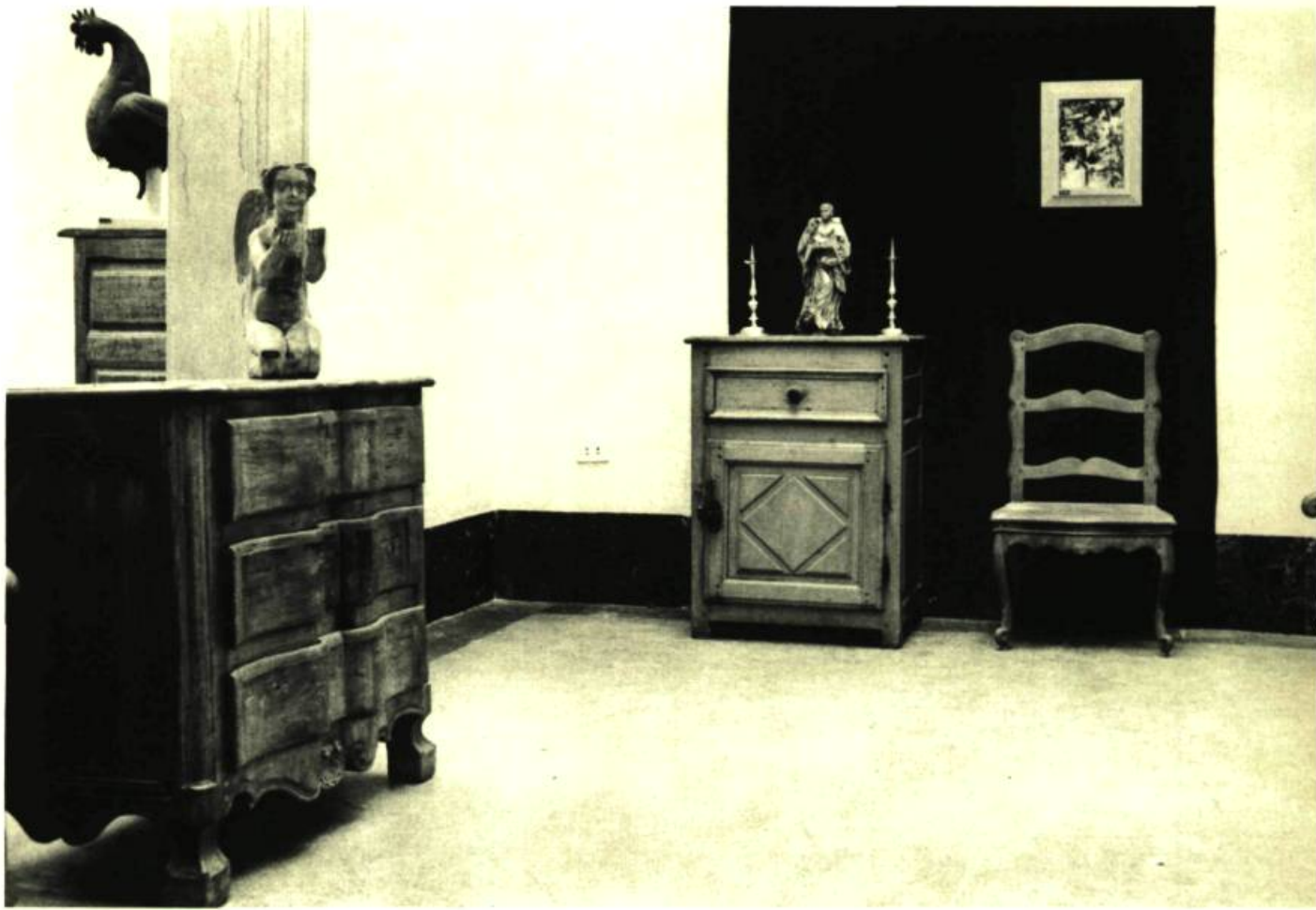
7 et 8. Arts traditionnels du Québec, nouvel aménagement.