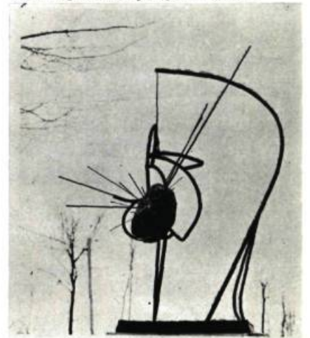
Jean Gauguet-Larouche Sculpture métal, 1964, 60" (153 cm)