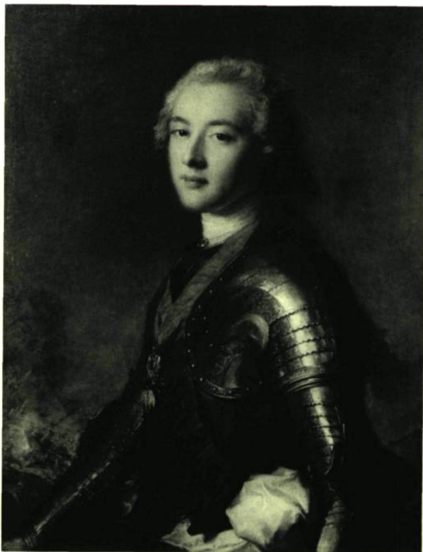
Jean-Marc Nattier. Paris (1685-1766).