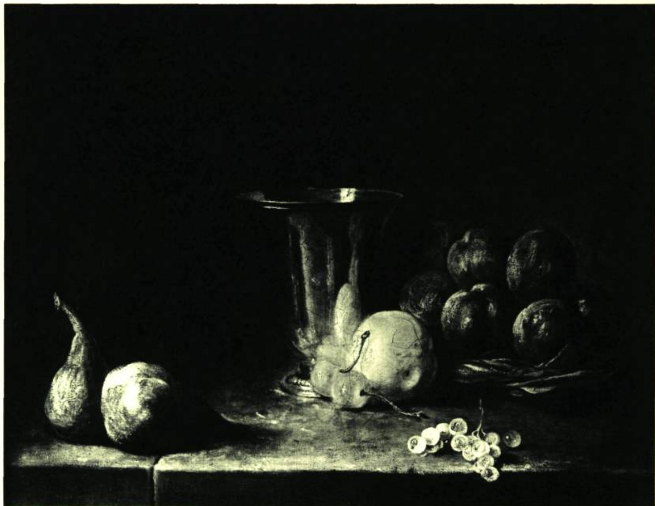
Jean-Baptiste Siméon Chardin. (Paris, 1699 - 1779). Gobelet et fruits. 13" x 17" (33,15 x 43,30cm). Musée des Beaux-Arts de Boston.

Chez Siméon Chardin, la poésie s'ajoute à la virtuosité; une poésie discrète qui vient plus de l'âme du peintre que des choses qu'il représente. Peintre sédentaire, Chardin a exploré les choses qui l'entouraient et en a tiré des compositions toujours équilibrées, parfois d'une simplicité admirable. Telle est la Nature morte que le Musée des Beaux-Arts de Boston a bien voulu prêter à la rétrospective.