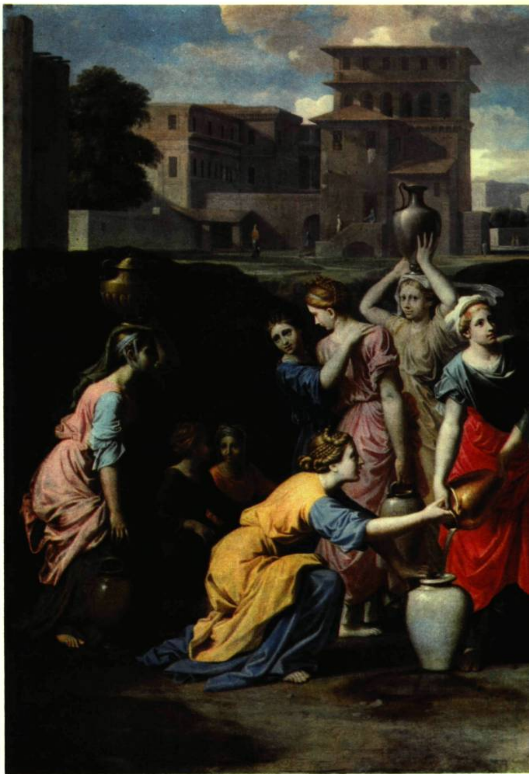
Nicolas Poussin. (Villers 1594 — Rome 1665). Eliézer et Rébecca. 46\frac{1}{2}'' \times 77\frac{1}{2}'' (118,50 x 197,45cm). Musée du Louvre.