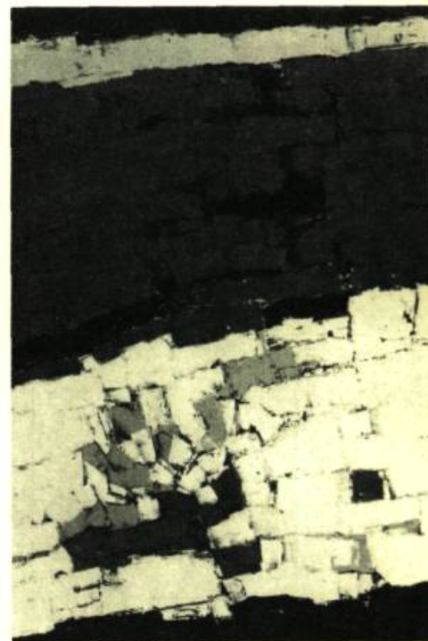
Invitation au voyage, 72" x 48" (183,45 x 122,30 cm.)