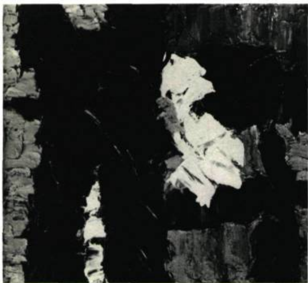
Chrysalide. 36" x 40" (91,70 x 101,80 cm.) Musée des Beaux-Arts de Montréal.