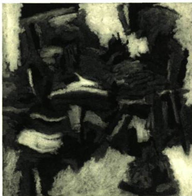
Deuce. 39½" x 39½" (100 x 100 cm.) Musée des Beaux-Arts de Montréal

Né à Kent, Angleterre, en 1930. Voyage en Espagne, en France et en Italie. S'établit au Canada au printemps de 1955. Etudes à l'École des Beaux-Arts de Montréal (1955-60). Participe à de nombreuses manifestations collectives: Salon du printemps du Musée des Beaux-Arts de Montréal (1957, 58, 60); Salon de la jeune peinture (1958-59, 60); Moins de trente ans (1957-58, 60); Expositions à la galerie l'Echange (1957), chez Denyse Delrue (1958), troisième biennale d'art canadien à Ottawa (1959). Expose aussi à London, (Ont.), Toronto, New York; le monde de la gravure et Contemporary Canadian Artists en 1961. Daghish a une de ses oeuvres dans la collection de gravures de la Galerie Nationale. Il a remporté le prix de la Fondation Max Beckmann et réside actuellement à New-York.