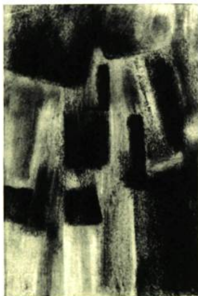
Pierres taillées par le vent. Fusain. 1961.

Etudes au couvent des Dames du Sacré-Coeur; deux années de philosophie à l'Université de Montréal; cours d'histoire de l'art à Rome; Ecole des Beaux-Arts de Montréal (1955-60). Juin 1960: bourse du Conseil des Arts du Canada pour travailler la gravure et la lithographie avec Albert Dumouchel. Expositions à travers le Canada; Salon des moins de trente ans en 1959; Peinture-jeunesse au Centre d'Art de l'Elysée en 1960.