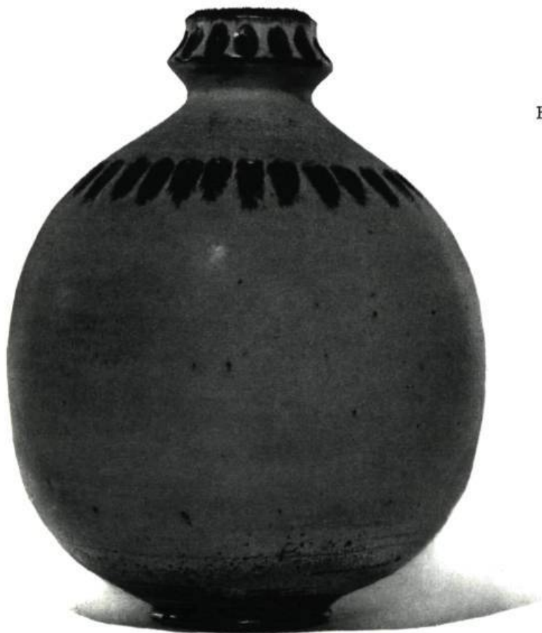
Bouteille ronde de céramique. Bailey Leslie (Toronto)