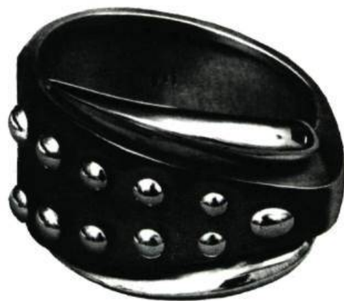
Bracelet. Argent oxydé clouté d'or.

L'exposition, évidemment, fait place aux arts esquimaux (neuf envois de statuettes) et indiens (dix envois d'objets divers).