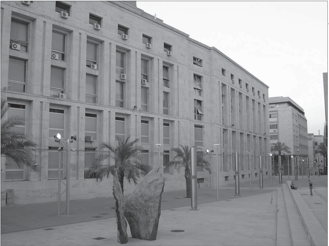
FIGURE 3 : Le nouveau Palais de justice de Palerme (2005).

que le regard porté sur Palerme a changé, comme en témoigne depuis une dizaine d'années l'augmentation des flux touristiques, non seulement en provenance de la péninsule italienne, mais aussi d'Europe, du Japon et des États-Unis. Leoluca Orlando a construit sa stratégie de marketing urbain autour du binôme mafia-antimafia. Ses effets sont doubles. Car si cette stratégie a sans nul doute permis à Palerme de présenter au monde entier une image renouvelée, l'image d'une ville combative et en pleine renaissance, elle a également contribué à ce que la ville demeure associée à la mafia. Ce discours était indispensable. Il le demeure tout autant aujourd'hui, notamment pour que la mobilisation de la population dans la lutte contre la criminalité mafieuse ne fléchisse pas. Pour sortir de cette impasse, il est indispensable de développer un discours parallèle qui mette en avant des qualités à la fois plus neutres et plus en phase avec les attentes des acteurs économiques que sont les touristes et les investisseurs (la spécificité du patrimoine artistique et architectural, la gastronomie, la qualité de vie...). La