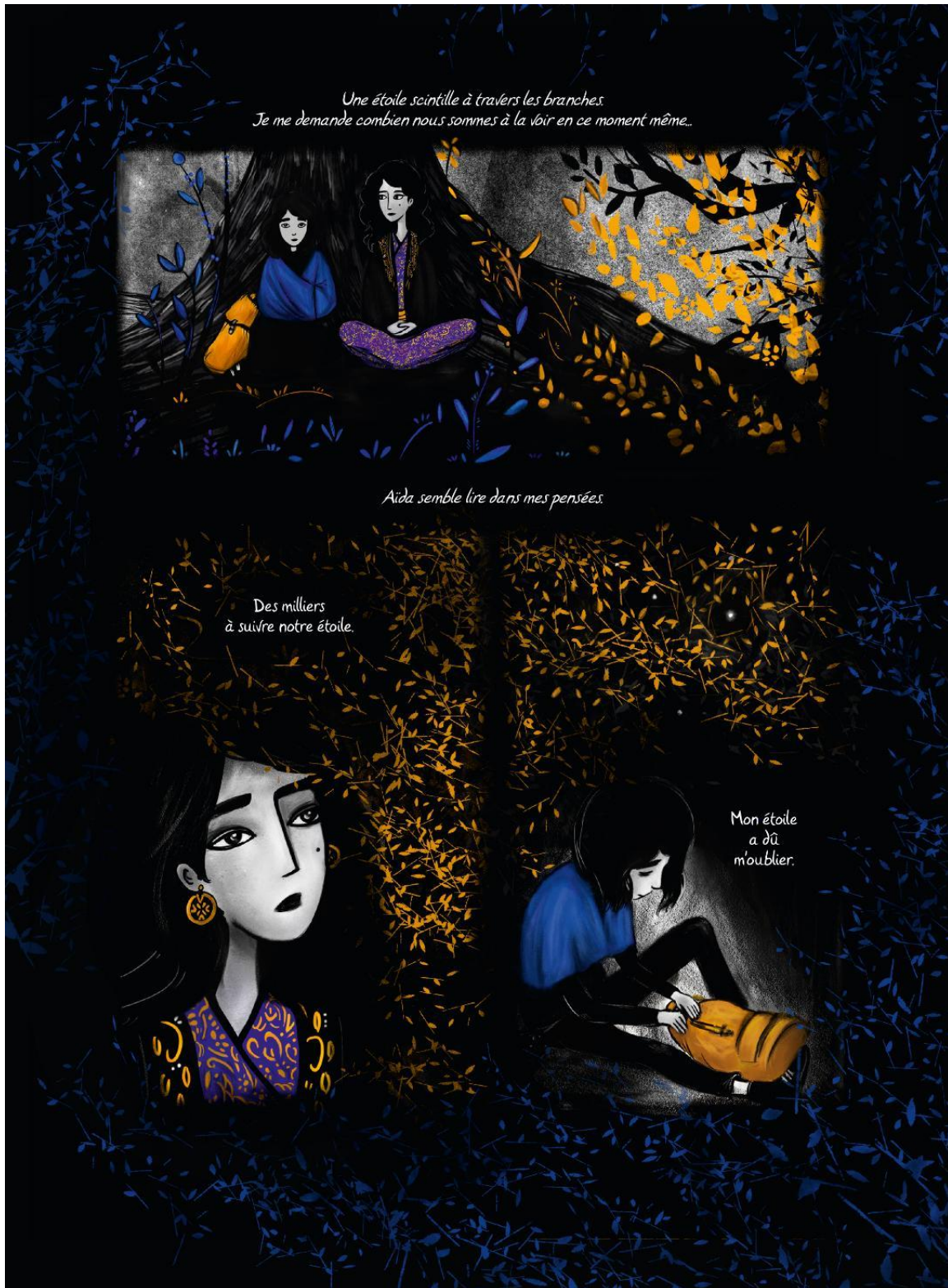
Les oiseaux ne se retournent pas, Nadia Nakhlé (2020, planche 5)