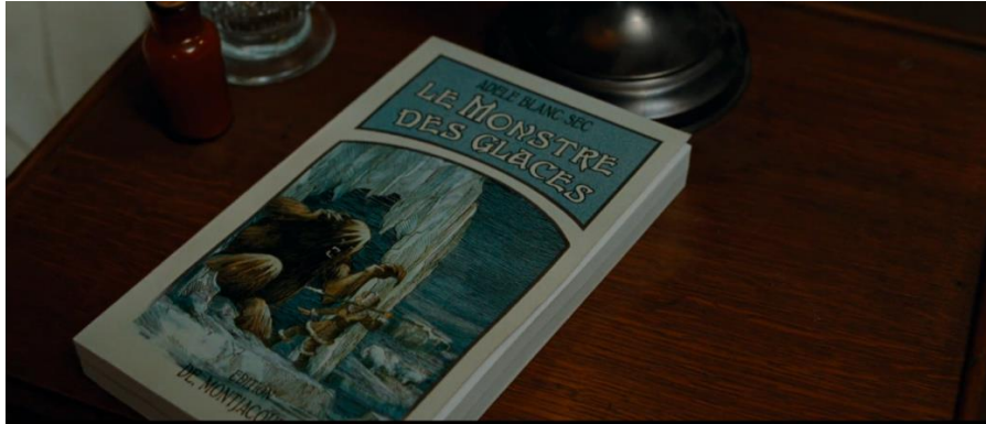
Figure 5 : Le roman Le Monstre des Glaces écrit par Adèle (10'34'')

respecter les codes puisque l'on ne reconnaît aucune maison d'édition populaire à succès (comme Tallandier ou Ferenczi) et que le format ne correspond pas non plus à ce que l'on attendrait d'un roman ou d'un fascicule populaire.