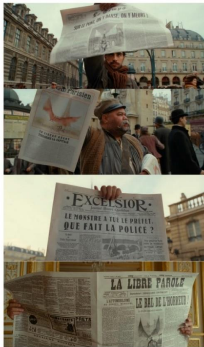
Figure 4 : Des crieurs de journaux au Président lisant un article sur l'affaire du ptérodactyle (montage, 26'44'' à 27'16'')

Dans son œuvre dessinée, Tardi accorde une large place à la culture médiatique contemporaine d'Adèle et notamment à la presse. Les journaux sont un puissant embrayeur narratif et c'est par ce biais que les lecteurs, tout comme Adèle, suivent la progression de l'intrigue ou l'incursion d'un événement perturbateur. À cet égard, Tardi inclut souvent, en pleine case, de nombreux entrefilets de journaux, destinés à relater certains épisodes non dessinés, comme les attaques répétées du ptérodactyle (1976a, p. 8-9). Si leur utilisation participe évidemment de l'effet de réel, elle permet aussi de faire participer le lecteur à l'enchevêtrement narratif et au mystère qui s'épaissit, en lui donnant à lire le récit partiel des faits chroniqués par les journalistes. Besson donne lui aussi à voir plusieurs titres de presse, comme Excelsior ou Le Petit Parisien , vendus par des crieurs (figure 4). Il utilise la lecture silencieuse des titres par certains personnages comme moyen de précipiter l'action : là, Caponi lit Le Petit Parisien avant de se voir confier l'affaire du ptérodactyle ; ici, Adèle découvre dans L'Intransigeant qu'Espérandieu est condamné à mort.