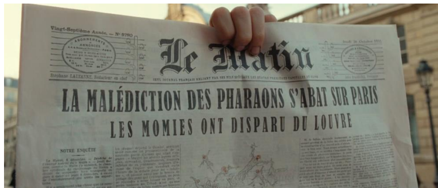
Figure 6 : La une consacrée à la « Malédiction des Pharaons » (1h31'58'')