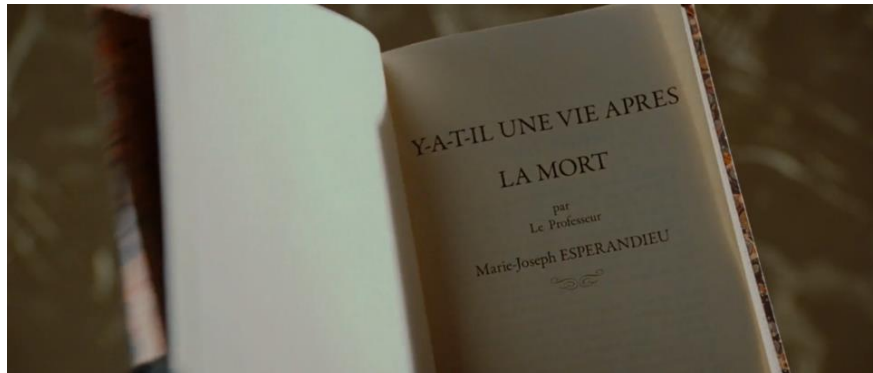
Figure 3 : Page de titre de l'essai de nécrobiologie (20'31'')

Le thème de l'animation ou de la réanimation de choses mortes ou plongées en anabiose, omniprésent chez Tardi 7 et poncif des films d'aventures archéologiques, apparaît chez Besson sous une forme nouvelle puisque, dans les albums, ce n'est jamais Adèle qui pratique ces expériences contre-nature appelées « Système Boutardieu » ou « étude de la vie après la mort ». Dans le film, Adèle souhaite utiliser les principes énoncés par Espérandieu dans Y-a-t-il une vie après la mort (figure 3) dans le but de réveiller Patmosis afin qu'il guérisse Agathe.