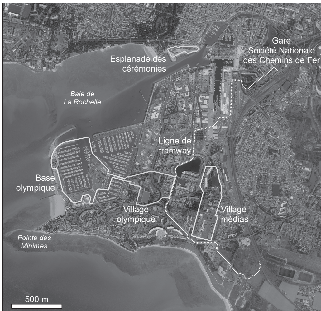
ILLUSTRATION 2 : Projet d'aménagement du village olympique, La Rochelle, Orthophotographie 2010, Institut Géographique National (carte : Dussier, 2014).

Autre argument important, les aménagements sont pour la grande majorité d'entre eux déjà réalisés (illustration 2). Cette situation présente un avantage économique, mais permet aussi d'éviter les risques liés à la planification et à la construction (non-respect des délais de livraison, malfaçon, conflits, réutilisation). Le coût de l'organisation serait donc de 26 millions d'euros et les délais pour réaliser les travaux de rénovation laisseraient des marges. De plus, Paris profitera de l'expérience acquise dans l'organisation d'autres manifestations sportives ce qui constitue toujours une garantie rassurante pour le CIO (Machemehl et Robène, 2014). La marina, les 20 000 m 2 de stationnements pour le village des coureurs et les bateaux, les trois cales de mises à l'eau, les 720 mètres de quais, la plage des Minimes constituent des espaces de circulation, de stockage, de stationnement et d'accès régis par des règles de fonctionnement qui ont déjà été éprouvées à l'occasion de compétitions non olympiques, mais dont les flux de sportifs, bateaux, journalistes et organisateurs sont comparables. La station météo complète le dispositif dans la mesure où elle donne des éléments de sécurité sur le site de pratique et permet une connaissance précise et utilisable de manière équitable du plan d'eau.