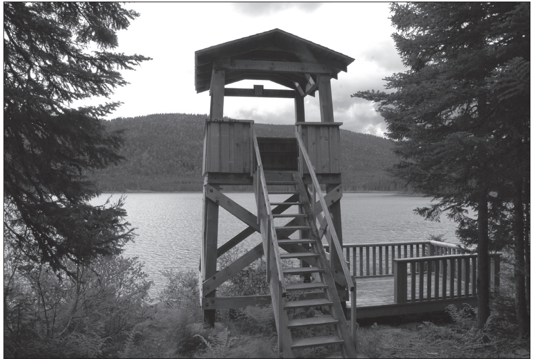
ILLUSTRATION 3 : Tour d'observation dans le parc national de la Gaspésie.

En ce qui concerne le tourisme d'observation, une analyse critique des impacts de cette forme de tourisme sur l'environnement amène à réinterroger son caractère non consommptif de la ressource. En effet, au regard de la littérature concernant les impacts du tourisme d'observation sur les grands mammifères, il apparaît que cette forme de tourisme transforme le comportement des animaux et l'utilisation de leur habitat, gêne les cycles de reproduction, augmente le stress animal... (Knight et Gutzwiller, 1995; Gander et Ingold, 1997; Stankowitch, 2008; Taylor et Knight, 2003). Les divers effets du tourisme d'observation poussent certains auteurs (Tremblay, 2001; Meletis et Campbell, 2007) à remettre en cause le fait de considérer les activités d'observation comme des formes touristiques non consommptives. Ils appellent à reconceptualiser le tourisme d'observation afin de reconnaître cette forme de tourisme comme un tourisme consommptif dont les effets ne sont pas forcément immédiats, contrairement à la chasse.