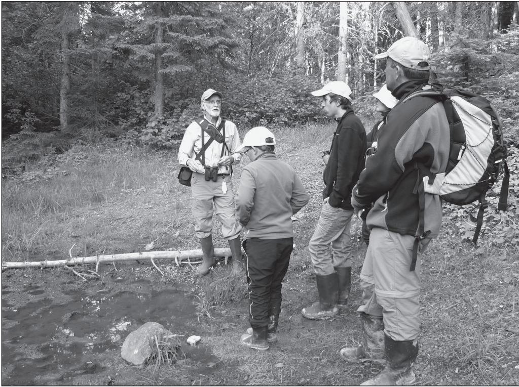
ILLUSTRATION 4 : Visite d'une vasière dans la réserve faunique de Matane (source : L. Chanteloup).

Au sein du parc national de la Gaspésie, depuis sa refondation en 1981, on essaye de développer un tourisme d'observation qui ne serait pas basé sur une interaction directe avec les animaux. Par exemple, le comportement des visiteurs est particulièrement surveillé à l'égard du caribou de la Gaspésie, animal dont la population est aujourd'hui menacée. L'accessibilité aux sommets où est présente cette espèce est réglementée : les randonneurs ont pour consigne de s'arrêter en présence d'un caribou et de lui laisser la priorité de passage. Les activités touristiques organisées autour de l'animal consistent en un espace muséographique consacré à l'espèce et à des ateliers d'informations organisés par les gardes naturalistes. Quant à l'orignal, qui est la deuxième espèce phare du parc pour les activités d'observation, même si cette espèce n'est soumise à aucune mesure de protection spécifique, le parc prône la non-interaction. Il souhaite laisser évoluer les animaux dans leur milieu naturel en leur apportant le minimum de dérangement possible. Dans un secteur fortement fréquenté par l'orignal comme le chemin de randonnée Ernest Laforce, des panneaux interdisent aux randonneurs de sortir des sentiers pour suivre les orignaux. En période de reproduction, il est également demandé aux visiteurs de ne pas pratiquer l'appel de l'orignal afin de ne pas entrer en contact direct avec eux (voir illustration 3).