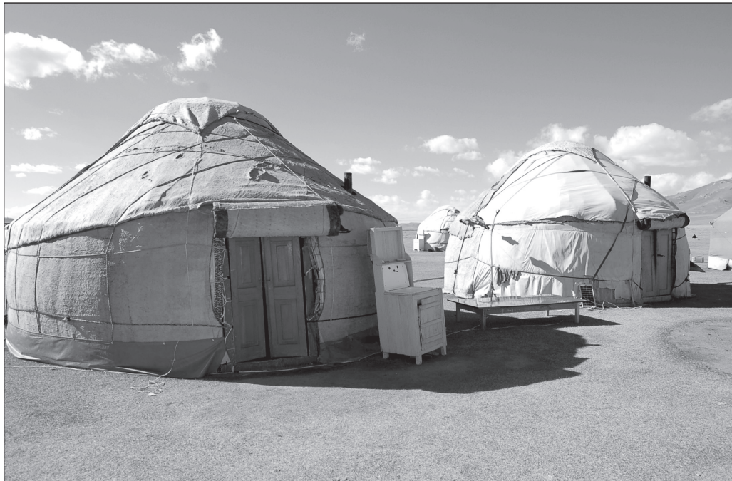
ILLUSTRATION 2 : Lavabo et panneau solaire autour des yourtes, Song Köl, Kirghizstan. (photo : Johanne Pabion Mouriès).

en créant près de 2 000 emplois pour les femmes. Elle a ainsi reçu le prix de Women's creativity in rural life 2005, délivré par la Fondation du Sommet mondial des femmes (Women's World Summit Fondation). Considérée comme la meilleure entrepreneuse en milieu rural, ayant mis en place «le tourisme nomade et le développement durable» (WWSF, 2011), Mairam s'est vue récompensée par un don de 500 dollars, une photographie dans la presse locale et un article dans un journal diffusé à l'échelle internationale.