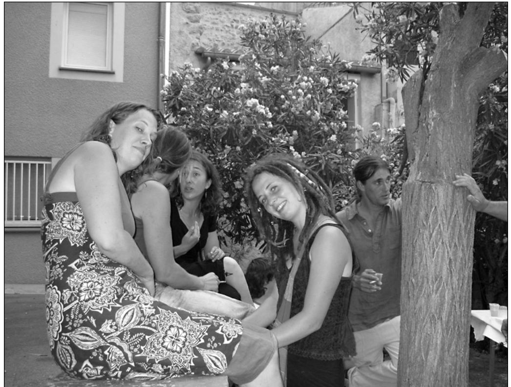
ILLUSTRATION 9 : Bénévoles de REMPART à la fête du 14 juillet 2010 à Opoul, 2010.

architecture ou en histoire de l'art, mais aussi des retraités, et des travailleurs de tout horizon. Certains sont là pour réaliser un stage relié à leurs études, les autres pour découvrir le pays d'une façon différente. L'objectif, explique en entrevue Estelle Dedeband, présidente de Terre de pierres, est d'accueillir les bénévoles qui viennent donner de leur temps, et en échange on leur offre une initiation aux gestes ancestraux de la construction rurale (Choron, Lllamarich et Mathou, 2010). Tous participent donc aux restaurations en apprenant les bases du métier de maçon (voir illustration 8).