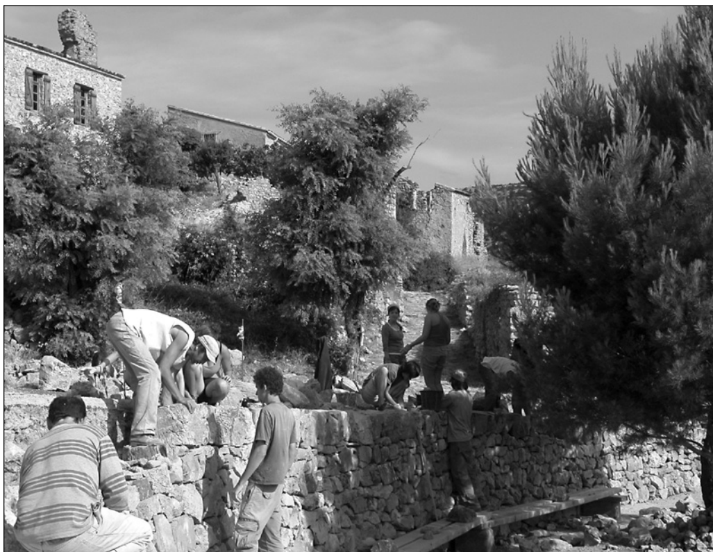
ILLUSTRATION 8 : Animateurs et stagiaires, 2010.

la préservation de l'intégrité du paysage culturel des Pyrénées-Orientales. Aujourd'hui, Terre de pierres est contrainte d'acheter sa chaux, car il n'y a plus de fours à chaux dans la région. Autrefois la question ne se serait pas posée : le calcaire était brûlé sur place. Terre de pierres espère d'ailleurs un jour pouvoir tenter l'expérience.