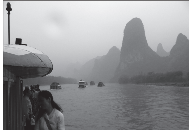
ILLUSTRATION 3 : Paysage brumeux du fleuve Li, apprécié par les touristes intérieurs.

des espaces « répulsifs », réservés à la population paysanne de laquelle les touristes, en majeure partie originaires des villes, essayent au maximum de se distinguer.