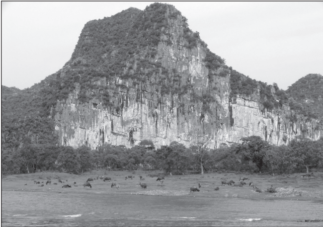
ILLUSTRATION 2 : Un paysage du fleuve Li, apprécié par les touristes occidentaux.