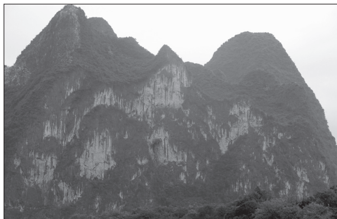
ILLUSTRATION 4 : La colline de la fresque des neuf chevaux.