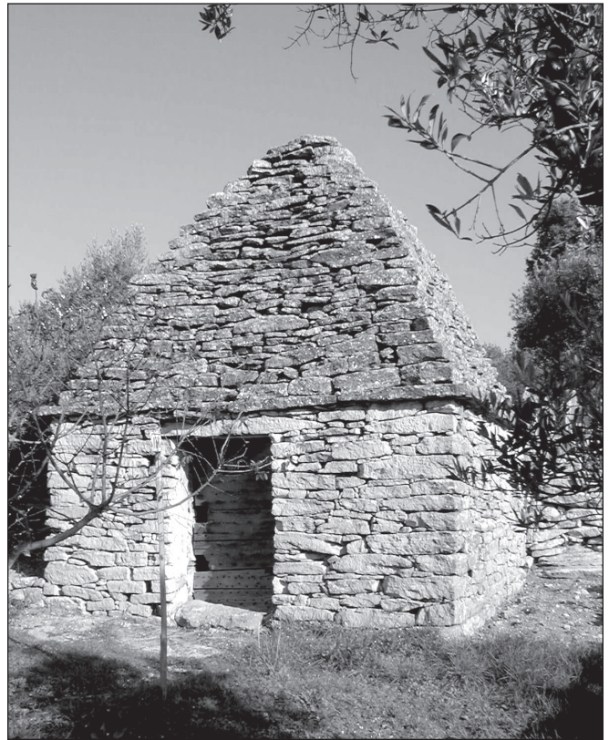
ILLUSTRATION 5 : Le « petit patrimoine rural », une borie et une oliveraie restaurées par des Parisiens « revenus » au pays (Luberon, France).

Il faudrait aussi replacer la part de « patrimonialisation » qui découle de ce tourisme de racine dans le contexte, propre aux pays riches d'accueil, du vieillissement accentué de leur population. Vieillesse qui s'exprime par une montée des conservatismes dont la « nostalgie », le culte du souvenir et l'appétit mémorialiste sont des modes d'expression privilégiés, de la part de ceux (les retraités en particulier) qui ont les moyens d'y répondre concrètement par de l'investissement présentiel et résidentiel, l'achat d'objets de brocante-antiquité, les investigations généalogiques, l'exploration des liens passés familiaux et amicaux, relayés et appuyés en cela par des sites internet dédiés à la recherche de proxémies oubliées et de