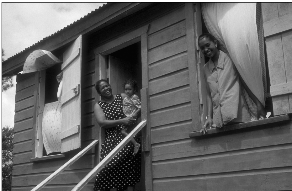
Accueil au village dans le sanctuaire des Baboïns au Belize.