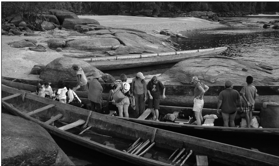
Remontée du Rio Caura vers le territoire des amérindiens Ye'Kuanas de Surapire à bord d'une pirogue.