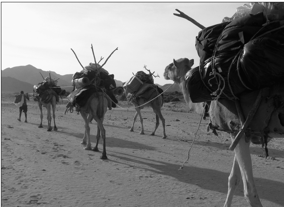
Caravane chamelière solidaire à Djibouti, inspirée des parcours de transhumance des Issa-Somalis.

Les membres d'ABM sont par exemple des passionnés qui voyagent dans le respect des