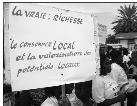
Marche populaire lors de la 3 e rencontre sur la globalisation des solidarités, Dakar 2005.