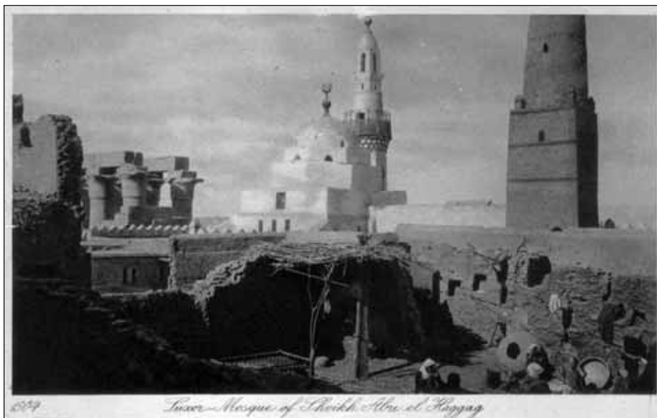
Carte postale fin XIX e . Louxor (Égypte), le village au premier plan, le temple et la mosquée au second.

The number of passengers for the Nile Steamers have been greater than could be comfortably accommodated, and the only complaints we have received arise from overcrowding. To remedy this for next season, we have arranged for a weekly service of the Nile Steamers during the months of January, February and March (The Excursionist 7 ).