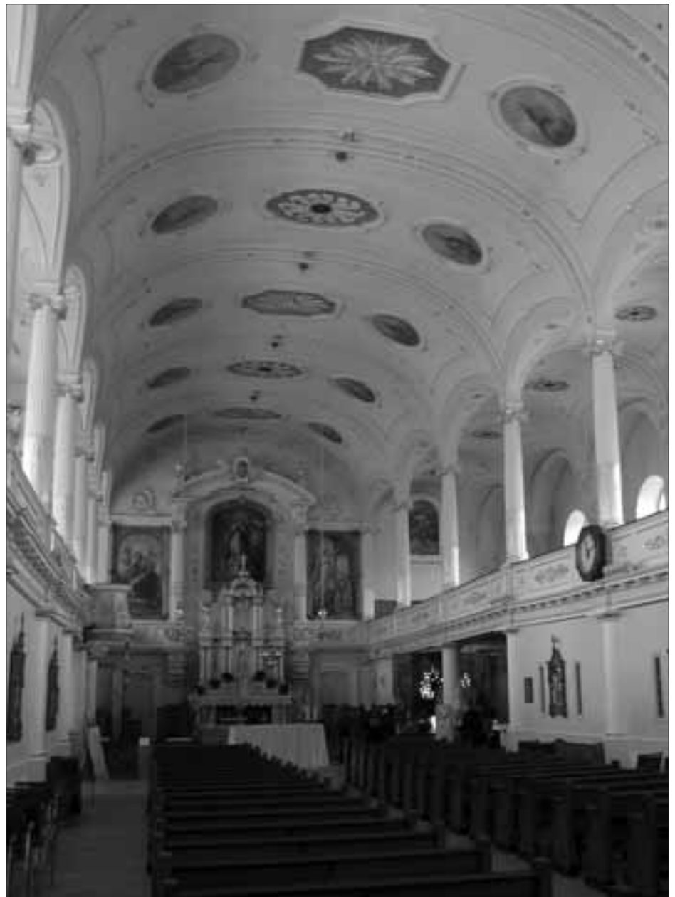
La nef « recyclée » de l'Église Notre-Dame-de-Jacques-Cartier, Québec, 2003 1 .

Le philosophe français Gaston Bachelard (1884-1962) avait reconnu l'importance des sentiments qui surgissent d'une expérience semblable. Il a même tenté de les systématiser quelque peu dans son livre La poétique de l'espace (1957). Indépendamment de sa contribution savante, un grand nombre de défenseurs du patrimoine ont recouru au genre de la « poétique de l'espace » afin de favoriser la sauvegarde des belles églises par leurs concitoyens, en s'efforçant de les sensibiliser au patrimoine. L'approche demeure encore d'actualité si l'on se fie à de récentes parutions, films documentaires, etc.