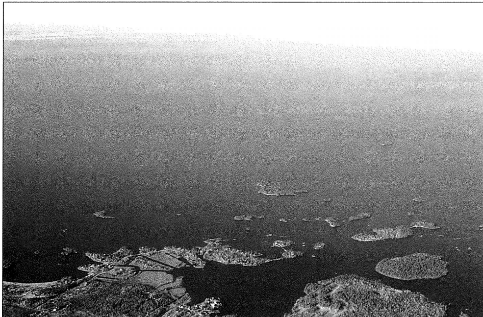
Vue aérienne du Lac Saint-Jean, photo Pierre Lahoud.

Ainsi, pour de plus en plus de monde, le Saguenay–Lac-Saint-Jean évoque immédiatement, voire signifie immédiatement, le Zoo de Saint-Félicien et le Village fantôme de Val-Jalbert. Ces deux monuments touristiques deviennent les véritables emblèmes de la région et leur promotion ainsi que leur visibilité entraînent le tourisme régional vers des sommets qui, une fois de plus, font des envieux. L'explication du succès est simple pour plusieurs observateurs de la scène touristique. Ces succès sont dus à la force de caractère des « Bleuets » car, quand ceux-ci décident quelque chose, ça se produit.