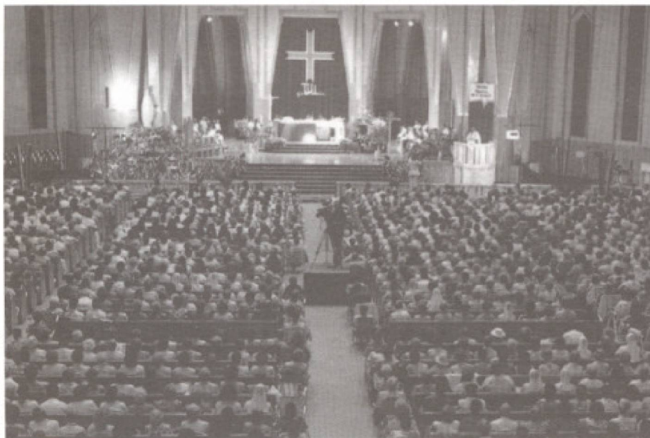
Intérieur de la Basilique du Sanctuaire Notre-Dame-du-Cap, Cap-de-la-Madeleine.

La fréquentation de ces sanctuaires est diversifiée. Dans les trois grands sanctuaires au Québec, on évalue comme suit le