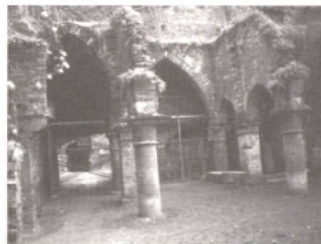
Ruines de l'abbaye de Villers-la-Ville.

Parallèlement, les menaces compromettant la survie du milieu rural face à l'évolution économique, la concurrence