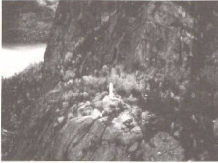
Notre-Dame-du-Saguenay sculptée par Louis Jobin en 1881. Située sur la première corniche du cap Éternité, à 11 km de Rivière-Éternité, la statue est accessible au public qui doit emprunter un sentier escarpé de 3,5 km. Classée œuvre d'art en 1965.

l'espace vide, s'y affermit les pieds sur le rebord du rocher, prit dans ses bras la statue par le socle et, prestement, la mit en place. D'après les sculpteurs qui l'ont taillée, le poids de la statue est d'au moins 1 200 livres » (Dragon, 1974 : 148-149).