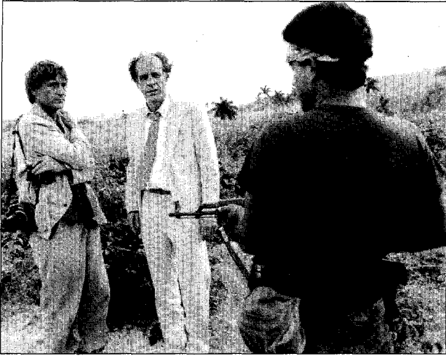
À corps perdu