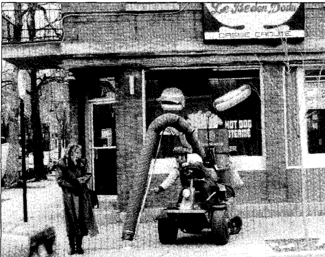
Les matins infidèles