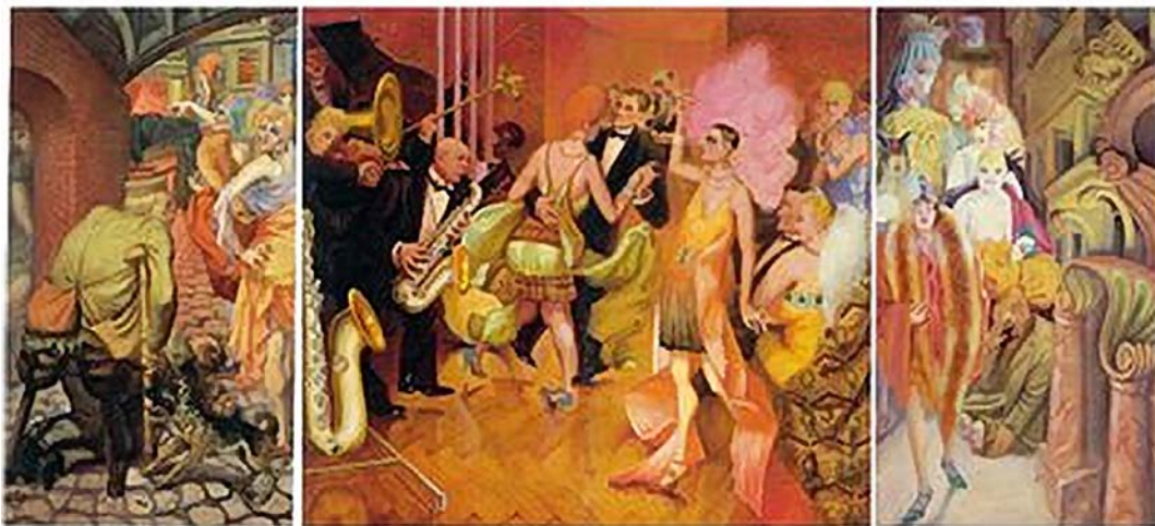
Figure 6: Otto Dix, Metropolis (1928).

proximité, en 1919, avec les cercles expressionnistes allemands. Au moment où il compose la Suite 1922 , Hindemith a mis en musique (ou s'apprête à le faire) des livrets d'opéras écrits par des écrivains phares de ce milieu comme Oscar Kokoschka, August Stramm, Franz Blei et Georg Trakl 38 .