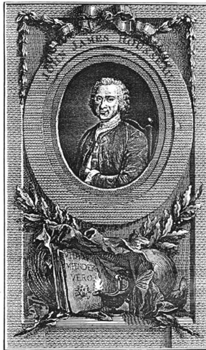
Figure 1: Portrait de John James Rousseau. Recueil des œuvres de musique de J. J. Rousseau (1788-1793), page frontispice.

Page frontispice: portrait en médaillon surmonté de l'inscription « John James Rousseau » (voir figure 1).