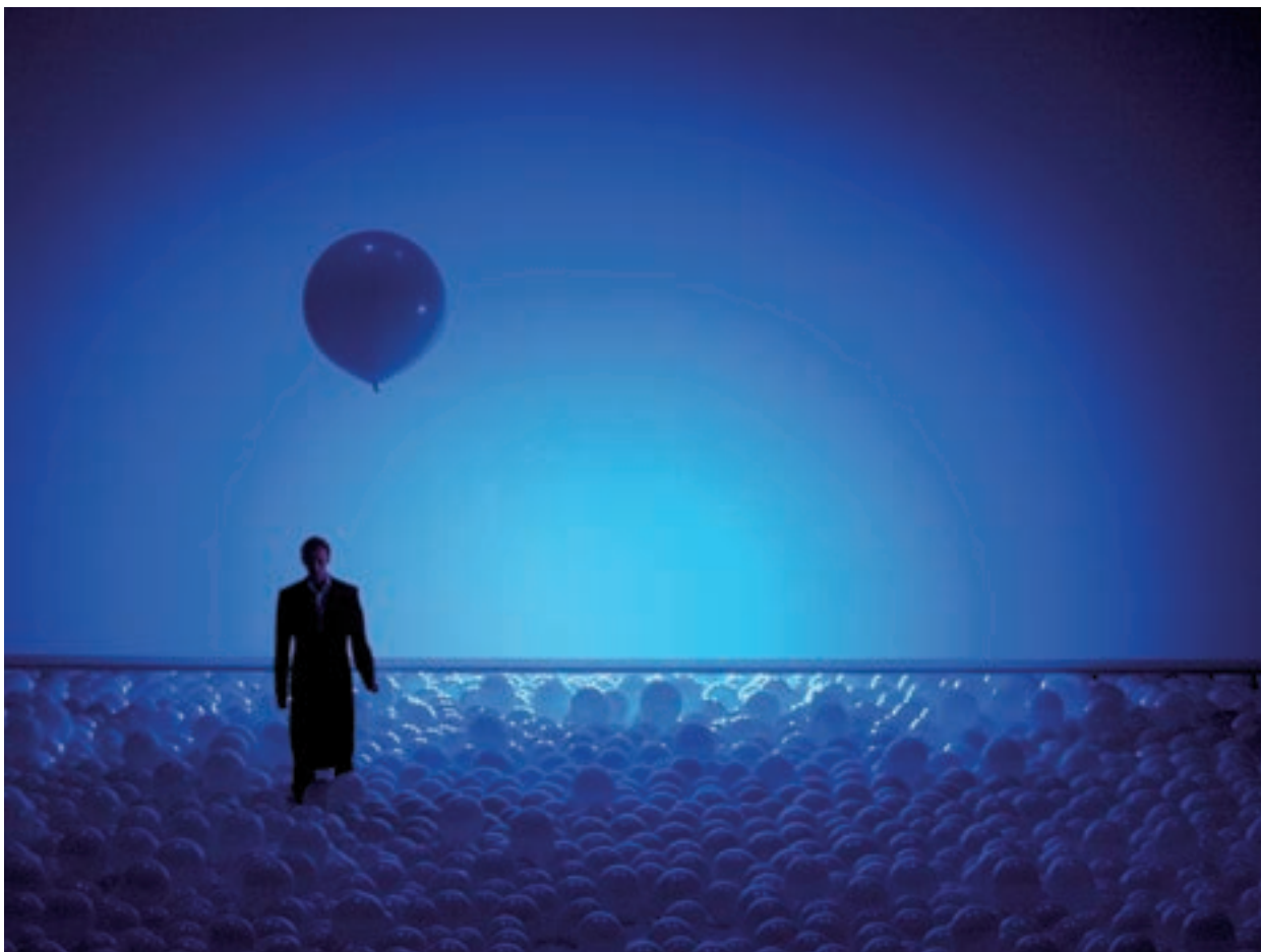
Face au mur.

Sarah Kane, Martin Crimp s'est toujours opposé à cette étiquette commode parce que superficielle, car la violence physique et la brutalité verbale sont aux antipodes de sa poétique du malaise d'individus confrontés au consumérisme, à la mondialisation et à l'hypermédiatisation.