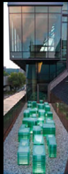
Mirabilia (arcarts de Montréal, Architectes : Provencher Roy Associés