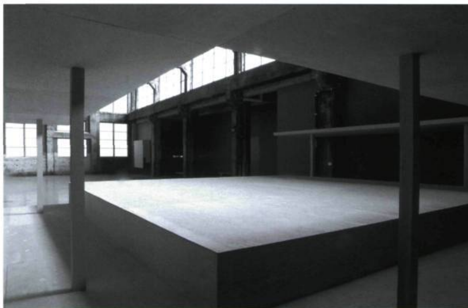
Alexandre David, Deux choses différentes (1 re œuvre, vue partielle), 2004, bois-contreplaqué. 267 × 1158 × 975 cm. Exposition à Quartier Éphémère à Montréal en 2004