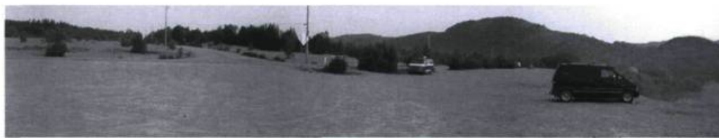
Ivan Binet, Étendues attendues , 2003, impression au jet d'encre, 350 cm × 20 cm, tiré de la série Répertoire d'horizons .

courage de dire comment ils ont formé leur œuvre, je crois qu'il n'y en a pas beaucoup plus qui se soient risqués à le savoir. Une telle recherche commence par l'abandon pénible des notions de gloire et des épithètes laudatives ; elle ne supporte aucune idée de supériorité, aucune manie de grandeur. Elle conduit à découvrir la relativité sous l'apparente perfection. »