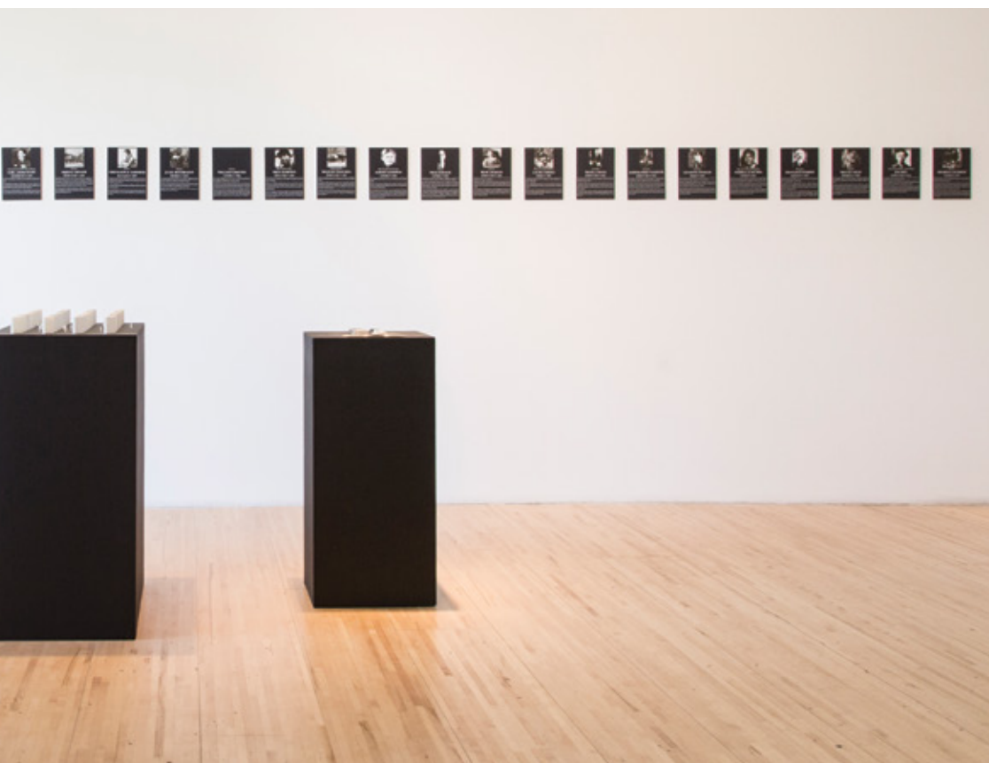
Projet EVA (Simon Laroche et Étienne Grenier) Micro-monuments souvenirs (Bientôt en vente !) , 2015. Archives de production.

Au directivisme du gouvernement, à la réduction idéologique et au cloisonnement du terme communisme de même qu'à l'unicité du monument, l'exposition Monuments aux victimes de la liberté répond par la multiplication des voix et la profusion d'objets dont certains tendent à déconstruire la forme traditionnelle du monument jusqu'à sa disparition.