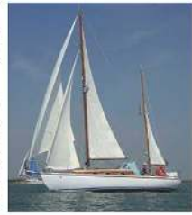
Amphitrite, avec voile dans le Pertuis Charentais pendant les régates de Marennes. Je le démonte alors que je crève un quintard : le Spc de l'Amphitrite en action est alors en train de faire le tour des côtes de Marennes. (cf. le dossier avec collection H. Cuvillier, propriétaire en 2017)

Les références du Lloyd [1] à [4] et [199] ainsi que les collections des revues Bateau , Le Yacht , Les Galéas et Yachting , Le Yachting [191] m'ont permis de collecter une très grande part des informations techniques relatives à ces compagnons de mer de Danycan.