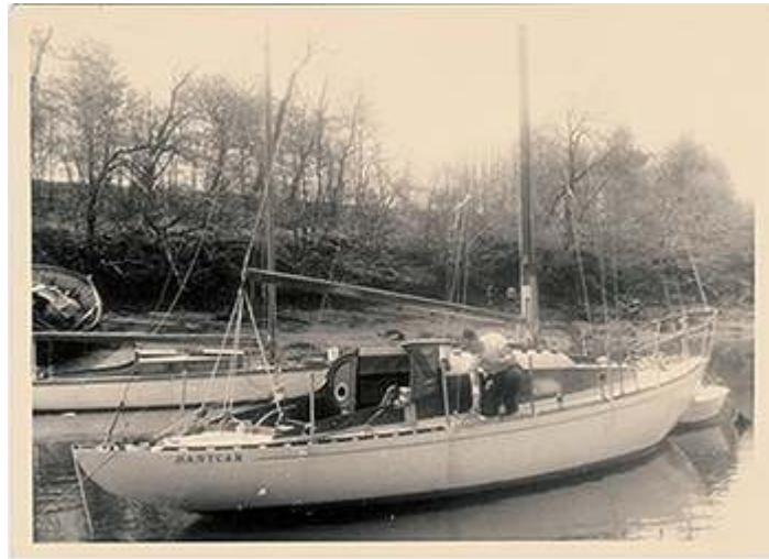
FIGURE 8 – Mouillage en 1964 à Conleau.