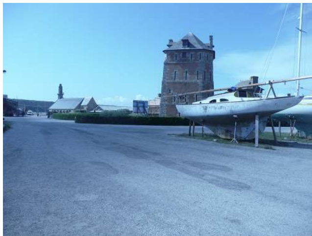
FIGURE 3 – Arrivée au chantier CMC – juin 2009.