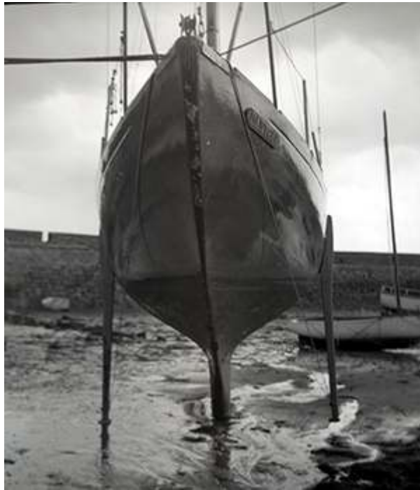
FIGURE 12 – Mouillage, dans le vieux port de Roscoff vers 1981.

Des déplacements dans de nombreuses librairies spécialisées ou des brocantes, et l'analyse d'articles, de livres, de répertoires du Lloyd ont complété ma quête d'informations. Je me suis rendu sur les lieux de l'établissement Pierre Delmez Constructions Nautiques et à Saint-Servan, cité où se situe la malouinière de la famille Danycan. Pour résumer, un travail d'investigation considérable m'a permis de reconstituer progressivement le contexte historique de ce voilier.