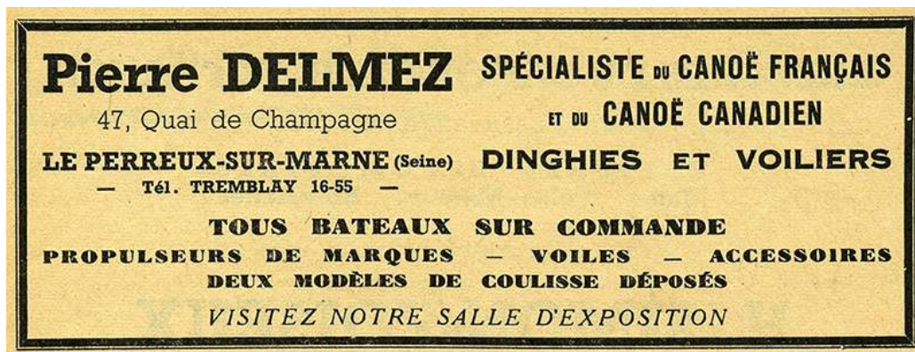
FIGURE 2 – Extrait de La Rivière – La revue du canoë club de France (avril 1947)