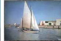
Cette petite Ariane - « Be de Ré (Classeur Marinier) & La Flote en Ré » - Ariane à Marennes-Albionis remonte dans la baie de Saint-Martin de Ré (cf. collection Marennes-Beaujeu - images - Collection A. Balogues)

Ariane : ce magnifique yawl honorié de Monsieur Le Bon en 1950 a souvent séjourné avec Danycan dans la région de La Rochelle. En revanche, je n'ai pas identifié de course-croisière commune parmi les programmes du RORC. Dessiné par Willy Van Hocht en 1914 et lancé l'année suivante à Kiel par les chantiers de son architecte allemand sous le nom d' Hansa II , il arrive à La Rochelle en 1918. En 1998, sous le nom de Milana , il remporte la première édition du Challenge Classique Marseilles