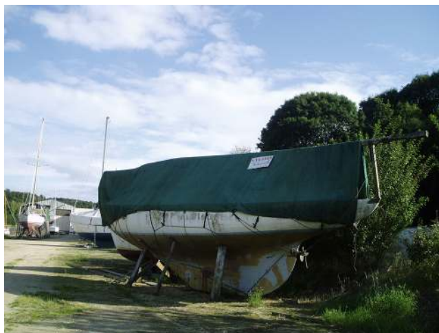
FIGURE 4 – Danycan, le jour de sa découverte en 2008 à Saint-Martin-des-Champs au chantier A. Jézéquel.