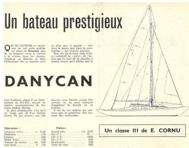
FIGURE 9 – Article paru dans la revue Le Yacht le 18 mars 1961