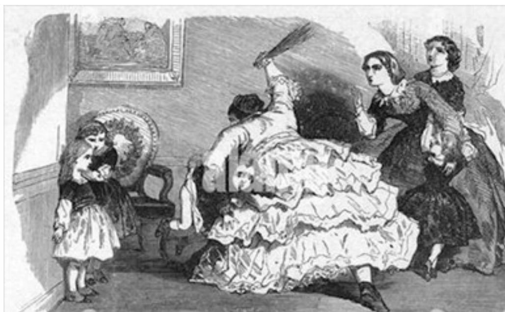
FIGURE 1 – Illustration des Malheurs de Sophie, Bertall, 1858.