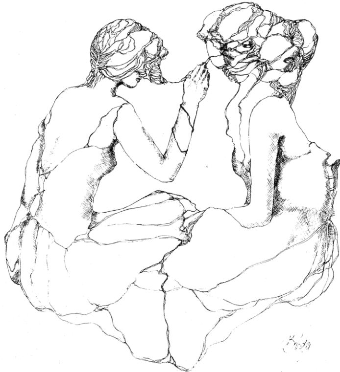
FIGURE 3 – Plume de Colette Bréger

Sur le plan pictural, d'ailleurs, ce présupposé fondamental de la revue s'exprime de façon éloquente dans ce dessin de Colette Bréger publié en 1977 dans lequel une femme écrit ou peint une autre femme, la faisant ainsi apparaître au monde, tout en acquérant elle aussi un nouveau statut, celui d'écrivaine ou d'artiste :