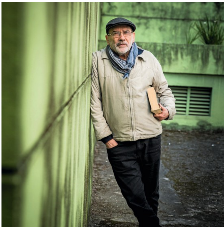
Figura 1: Ruy Fausto

O anúncio do súbito falecimento de Ruy Fausto, ocorrido em Boulogne-Billancourt no dia 1º de maio como consequência de um infarto, foi para nós, assim como para todos os seus numerosos amigos, um choque de uma tristeza infinita. Ruy Fausto foi presença constante em nosso Grupo de Es-