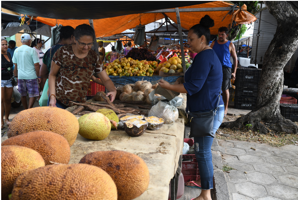
FIGURE 1 – Les fruits et le manioc assurent une alimentation saine pour tous.

A gente vai contra a corrente até não poder resistir Na volta do barco é que sente o quanto deixou de cumprir Faz tempo que a gente cultiva a mais linda roseira que há Mas eis que chega a Roda Viva e carrega o destino para lá (Chico Buarque. Roda Viva)