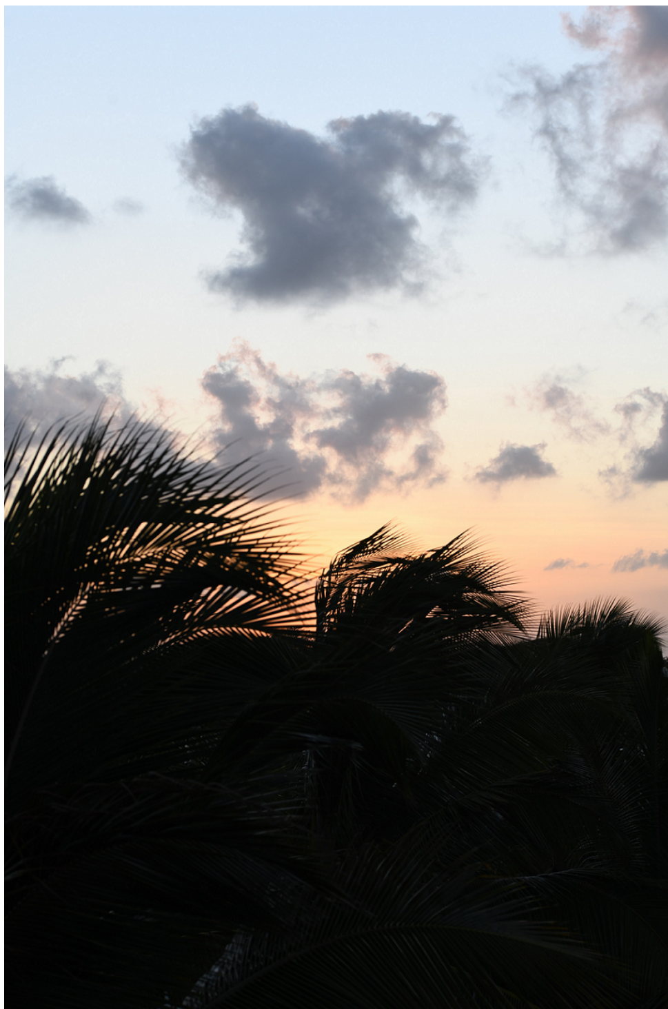
FIGURE 4 – Lumière atlantique.