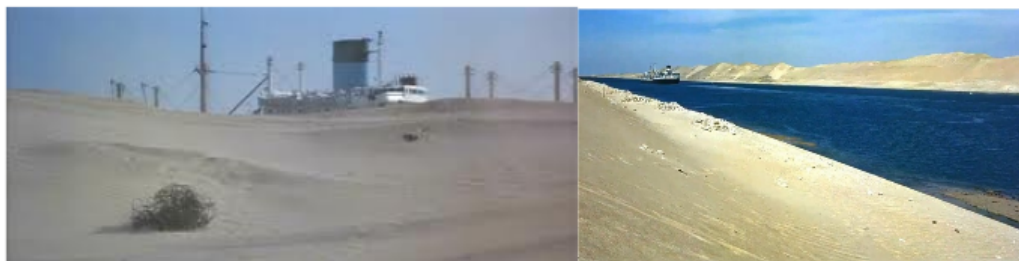
FIGURE 5 – Du mirage du paquebot dans le désert à la réalité du canal de Suez. Lawrence d'Arabie

L'immersion totale du spectateur et la mise en scène façon « montagnes russes » atteignent alors leur paroxysme lorsque le spectateur se retrouve