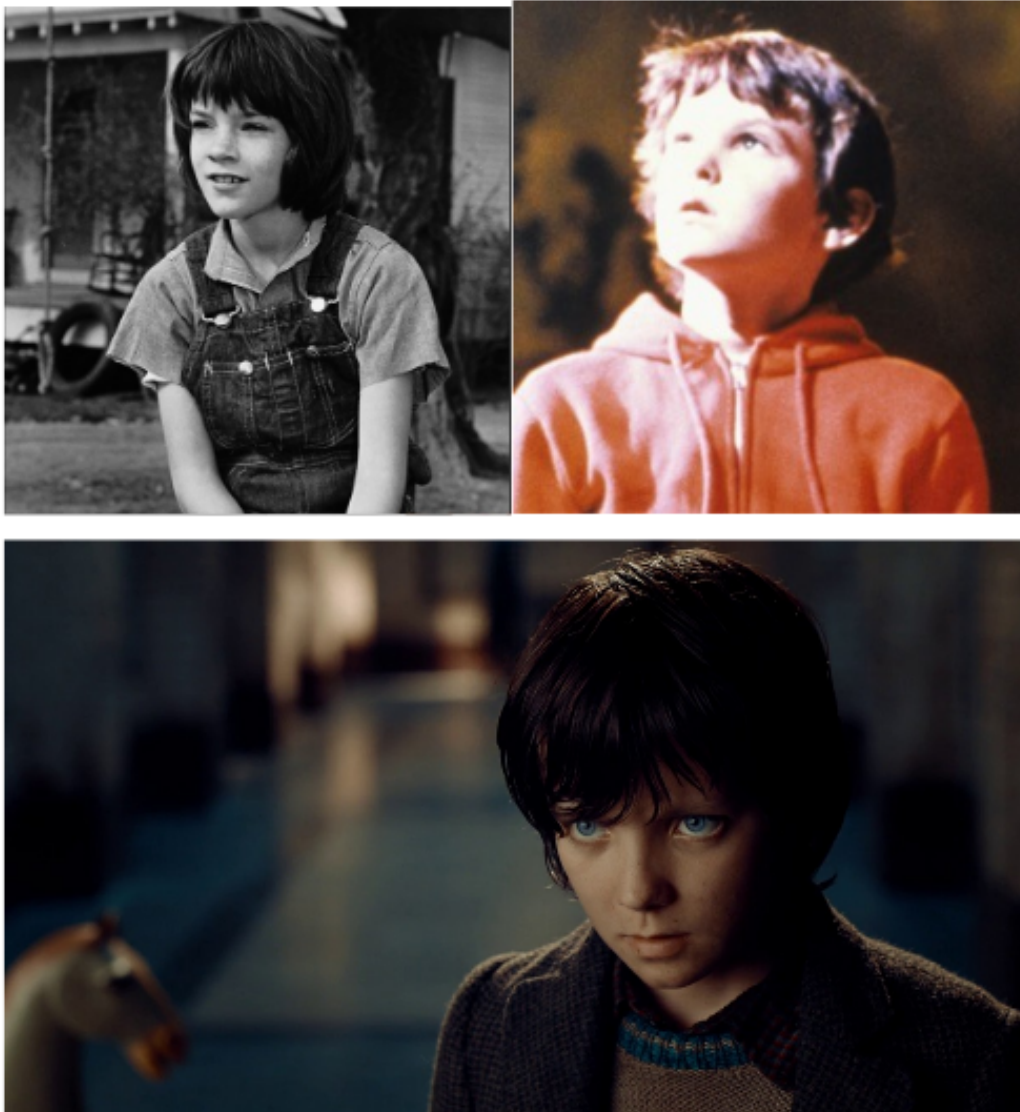
FIGURE 2 – Haut gauche : « Scout » (Mary Badham) dans Du silence et des ombres ; Haut droite : Elliott (Henry Thomas) dans E.T., L'extraterrestre ; Bas : Hugo Cabret (Asa Butterfield) dans le film éponyme

Les technologies numériques au service de la cinéphilie : l'hybridation ciné-picturale dans Tintin de Steven Spielberg et l'immersion cinéphile dans Hugo Cabret de Martin Scorsese