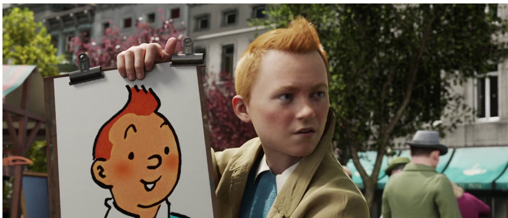
FIGURE 3 – Ouverture des Aventures de Tintin : Le Secret de La Licorne

La surface plane 2D et la technique particulièrement simple de la ligne claire offre avec le relief, lunettes 3D sur le nez, un contraste tout à fait saisissant. L'effet fait figure de choc pour le spectateur, qu'il apprécie ou non la conversion. Comment ce contraste se matérialise-t-il via cette technologie sur un simple plan, c'est Martin Scorsese qui nous apporte la réponse malgré lui dans une interview sur Hugo Cabret :