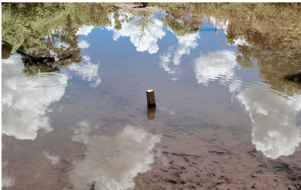
FIGURE 1 – Poço.

Une version de ce texte est parue en portugais dans la revue REALIS. Paul Cary, Jacques Rodriguez, 2020, « Concepções da natureza e as relações com o capitalismo : análise dos cenários pós-covid-19 na França », REALIS – Revista de Estudos AntiUtilitaristas e PosColoniais, vol. 10 (1), pp. 70-88. Nous remercions la revue de nous avoir autorisés à traduire le texte.