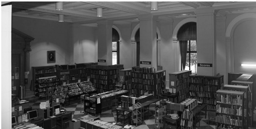
FIGURE 1 – Figure 1 : Salle de musique de l'actuelle Free Library de Philadelphie

Jetons un coup d'oeil à la Free Library de Philadelphie telle qu'elle est aujourd'hui :