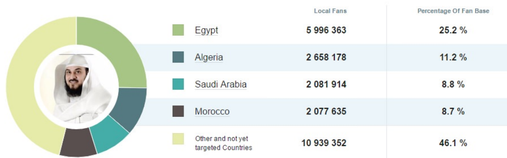
Figura 3: Impacto mediático de Muhammad al-Arifi ( Social Bakers )