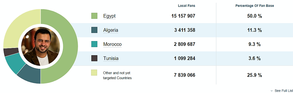
Figura 2: Impacto mediático de Mustafa Hosny [sic]

2. Muhammad al-Arifi (corriente salafista fundamentalista), con 23 933 804 de suscriptores.