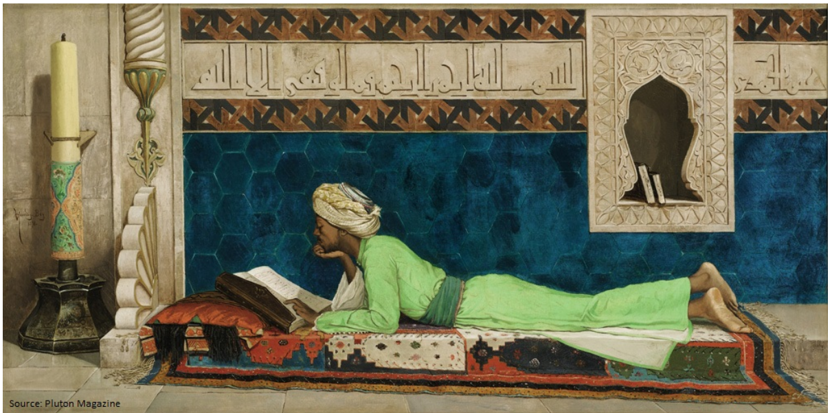
FIGURE 1 :