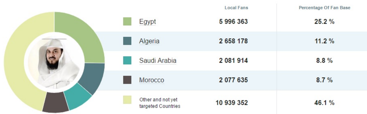
FIGURE 3 : Impact médiatique de Muhammad al-Arifi ( Social Bakers )