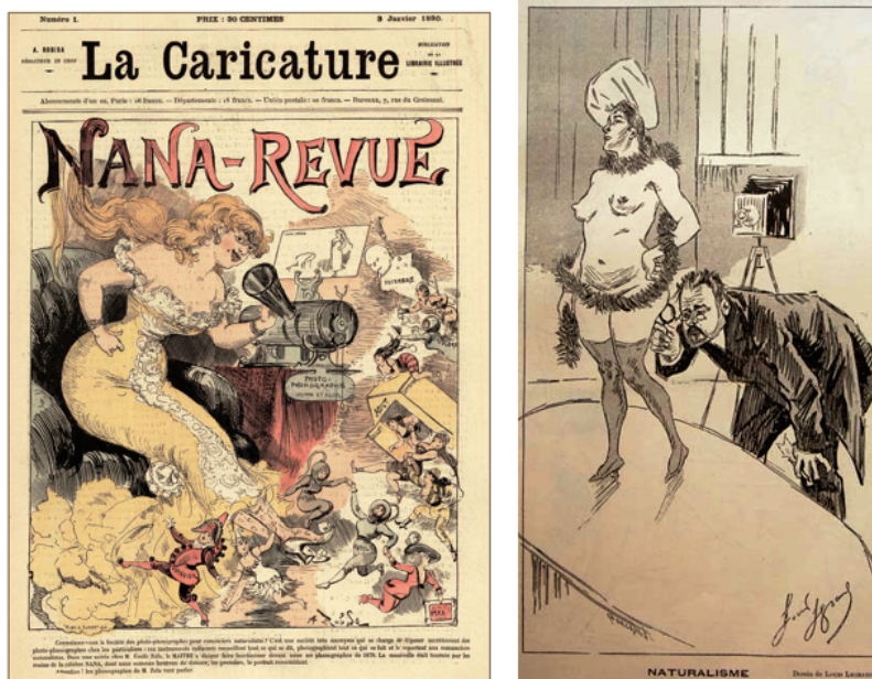
FIGURE 1 : Albert Robida, « Nana-Revue », La Caricature , 3 janvier 1880 et Louis Legrand, « Naturalisme », Le Courrier français , 30 mars 1890. Aussi scientifique prétend-il être, l'imaginaire naturaliste serait impossible sans de telles médiations...