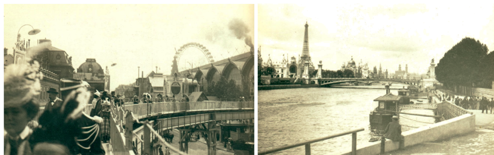
FIGURE 6 : Clichés de l'Exposition universelle de 1900 pris par Zola (Émile-Zola et Massin 1979) Qu'il soit au centre des images où derrière elles, l'écrivain est partout dans ces images d'un présent éternellement conservé dans l'ambre de la pellicule, d'autant plus que celle-ci est maintenant numérisée.