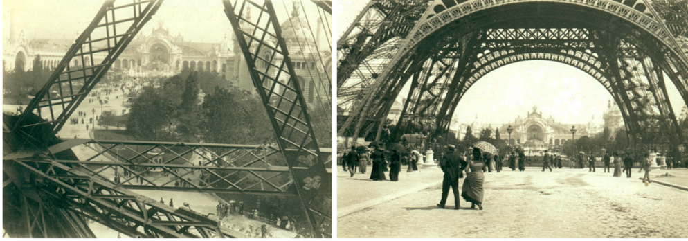
FIGURE 7 : La tour Eiffel en 1900 (Émile-Zola et Massin 1979) Contrairement au Zola romancier, le Zola photographe - le dernier Zola - laisse derrière lui un grand nombre de vues de la tour Eiffel.

amputée de ses principaux membres. Et aucune de ces omissions volontaires ne saurait être aussi majeure que celle de la tour Eiffel.