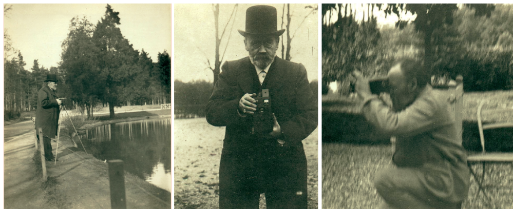
FIGURE 5 : Émile Zola dans son activité de photographe (Émile-Zola et Massin 1979)