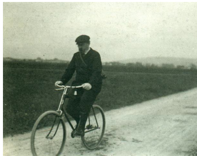
FIGURE 13 : Zola à bicyclette sur les routes de Médan, vers 1900 (Émile-Zola et Massin 1979) Bien en selle sur sa bicyclette, harnaché par la courroie de son appareil photo portatif qui le suit partout, l'écrivain n'est au fond pas si différent de l'« homo intermedialis » (Gaudreault) inventé par Grant à la même époque.