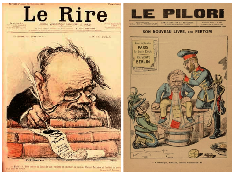
FIGURE 2 : Charles Léandre, « Émile Zola écrivant “J'accuse” », Le Rire , 20 novembre 1897 et Fertom, « Son nouveau livre », Le Pilori , 27 mars 1898. Épuisé ou malade, le corps de Zola - duquel sortent littéralement ses dernières œuvres - est maintenant d'abord et avant tout un corps médiatique.