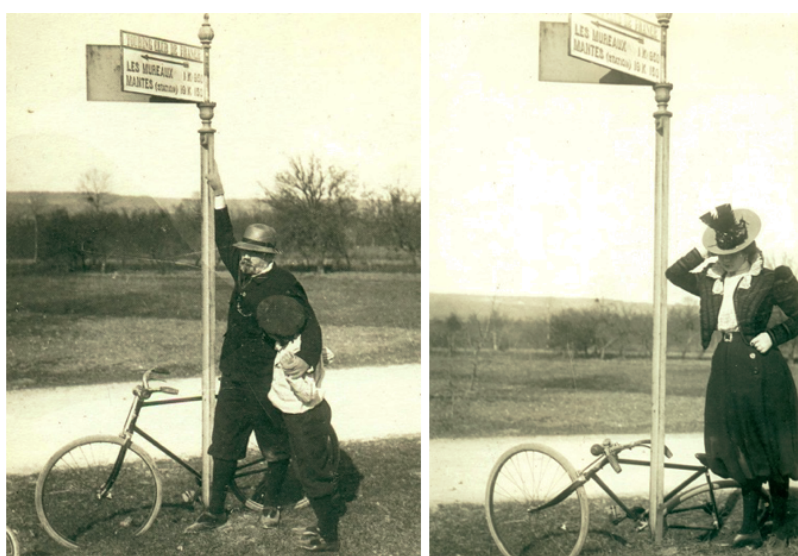
FIGURE 11 : Les rendez-vous à bicyclette à Médan, autour de 1900 (Émile-Zola et Massin 1979) Constamment photographiée - alliant ainsi les deux passions du dernier Zola - la bicyclette donne lieu à toute une série d'images nouvelles.