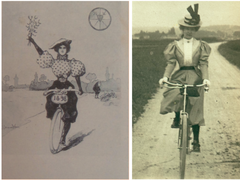
FIGURE 10 : Hansi (Jean-Jacques Waltz), dessin pour carte postale, 1898 et Jeanne Rozerot, également vers 1898. (Émile-Zola et Massin 1979) Le bouleversement de la vie privée d'un écrivain rejoint ici l'imaginaire médiatique et technique de toute une époque : le mouvement perpétuel des roues de la bicyclette nous assure que le changement - entre autres rendu visible par la jupe-culotte - est là pour de bon.