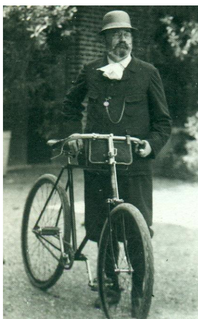
FIGURE 8 : Émile Zola partant à bicyclette, près de Médan (vers 1896) (Émile-Zola et Massin 1979) Tout un horizon affectif se cache derrière ce simple alliage métallique.