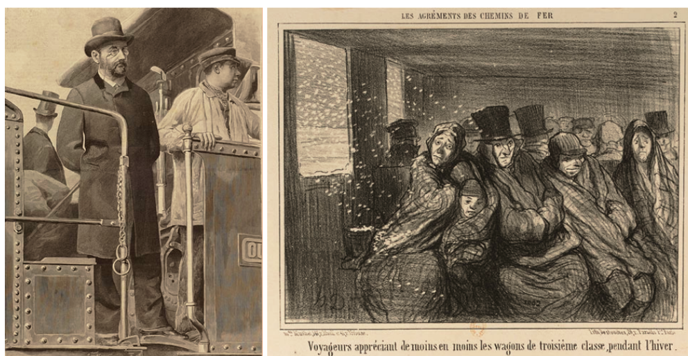
FIGURE 4 : « M. Émile Zola, dessin d'après nature, fait lors de son voyage de Paris à Mantes sur une locomotive », L'Illustration , 8 mars 1890 et Honoré Daumier, « Voyageurs appréciant de moins en moins les wagons de troisième classe, pendant l'hiver », Le Charivari , 25 décembre 1856. Ayant obtenu le privilège de la part des Chemins de fers de l'Ouest de faire le trajet à même la locomotive, l'expérience ferroviaire de Zola est bien différente de celle des passagers de Daumier, si bien que l'on en vient à se demander s'ils utilisent vraiment le même moyen de transport...