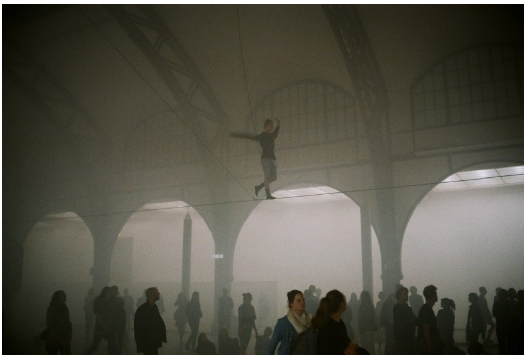
Angst II , crédit photo : Arturo Bamboo

trajectoire, ses pas deviennent hésitants. Elle s'arrête. Quelques instants plus tard, elle se met à marcher à reculons. Ce geste, inattendu et surprenant, provoque chez le spectateur tout un questionnement : vers qui se dirige-t-elle ? Pourquoi retourner en arrière quand sa promenade vertigineuse est presque achevée ? Que symbolisent ce rythme et l'aspect répétitif sur lequel l'artiste insiste ? Que cache le brouillard situé de l'autre côté de la salle vers lequel elle se dirige hypnotiquement ?