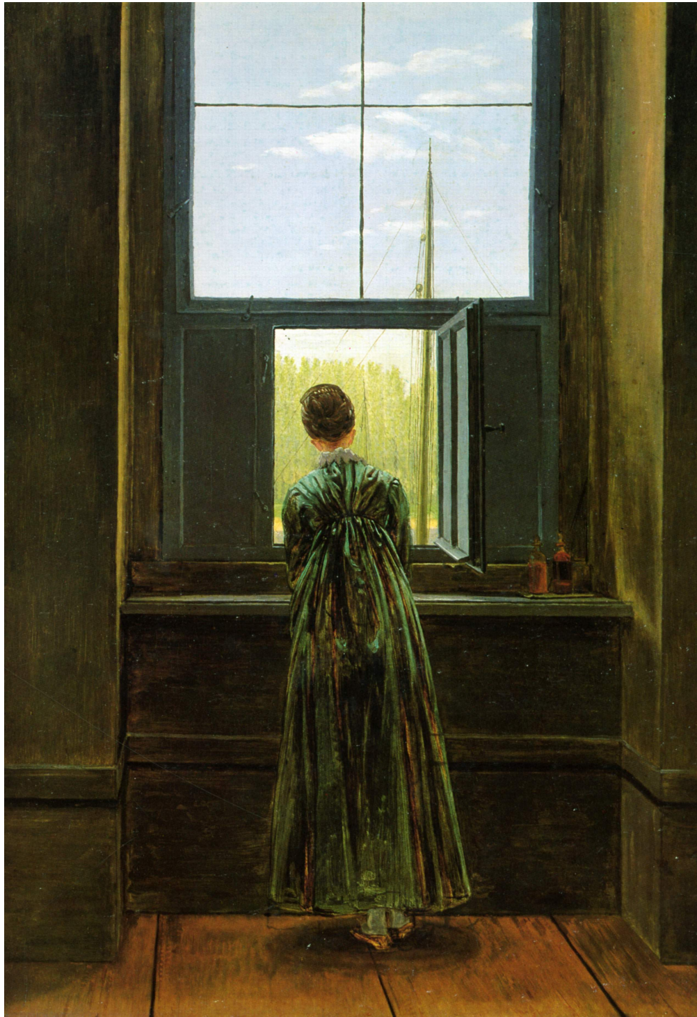
FIGURE 1 : Caspar David Friedrich, Femme à la fenêtre , 1822, Alte Nationalgalerie, Berlin.