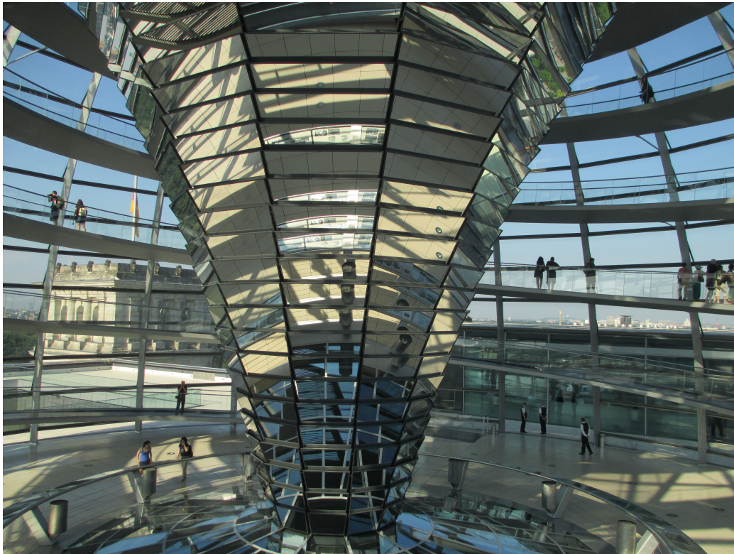
FIGURE 3 : Norman Foster, intérieur de la coupole du Reichstag, Berlin. Photographie d'Avishai Teicher, 25 juin 2016.