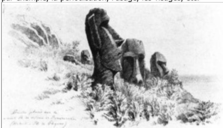
Dessin de Julien Viaud alias Pierre Loti Statues géantes des 'Iles de Pâques' 12 .

Mais on peut aussi complexifier ces deux situations. Imaginons que l'ensemble de ces nombreux modèles repose sur des sémantiques totalement autonomes et étanches l'un à l'autre : par exemple, si la sémantique des statues construite par un archéologue était complètement autonome et close par rapport à celle proposée par un anthropologue. Ainsi, ce que signifierait le mot « socle » dans un modèle serait radicalement différent dans les deux systèmes. Ou, encore, imaginons que leurs sémantiques se recouvrent ou se croisent. Par exemple, si pour ces statues géantes, la sémantique de l'archéologue et de l'anthropologue partageait certains éléments tels par exemple, la périodisation, l'usage, les visages, etc.